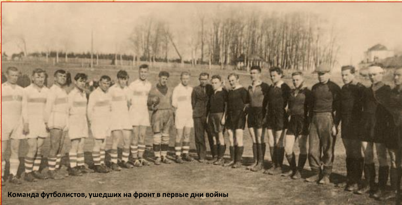
Команда футболистов, ушедших на фронт в первые дни войны

Несмотря на трудности военного времени, занятия не прекращались. В газете «Красный Север» от 3 июля 1941 г. было опубликовано выступление по радио Председателя Государственного Комитета обороны И.В. Сталина. Газета шла под лозунгом «Все силы народа на разгром врага». От коллектива Вологодского сельскохозяйственного института обратилась группа преподавателей и отличников учебы с заметкой «Объявляем себя мобилизованными на трудовом фронте». «В предстоящий период мы не имеем никакого морального права мирно отдыхать, когда наши братья – бойцы и командиры Красной Армии, не жалея своей жизни, ведут тягчайшую борьбу с наглым врагом». Наоборот, улучшилась дисциплина, значительно повысилась академическая успеваемость. Студенты IV курсов всех факультетов проходили 140-часовую программу военной подготовки и затем сдавали зачеты и экзамены.